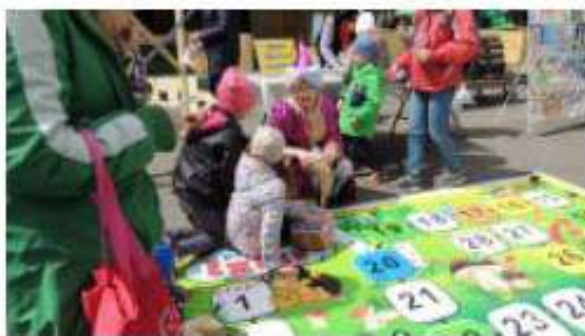
Театрализованная площадка г. Можги